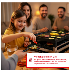
Vielfalt auf einem Grill Du grillst, wackerst, brätst, kochst, backst, dampfst, crepesst oder raclettest – mit nur einem Gerät für unendliche Genussmöglichkeiten.

Artikelnummer: S0127 EAN: 7611210977476 UVP: 279,90 EUR EK: nach Login