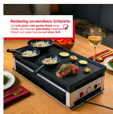
Beidseitig verwendbare Grillplatte Du bist links, aber gerade rechts umgedreht. Perfekt und flexibel von jeder Seite zu verwenden. Handelt sich um eine Grillplatte auf einer Seite.